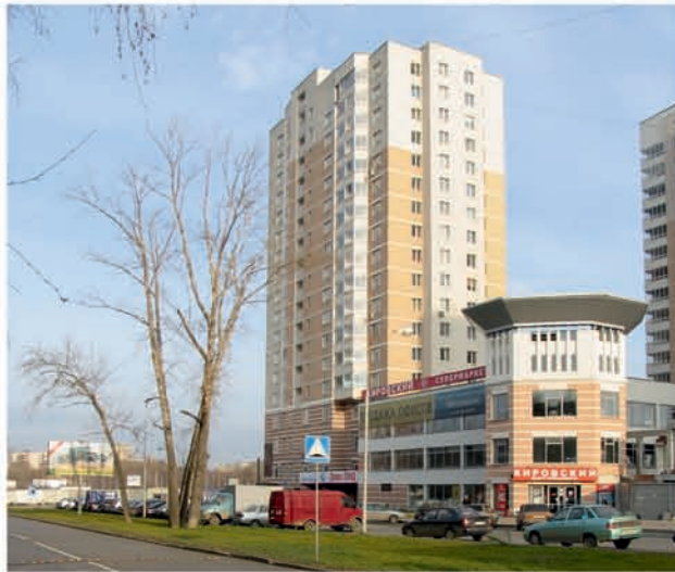
Жилой дом, 4 пусковой комплекс