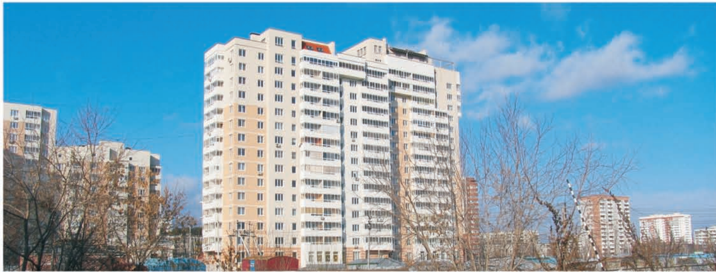
Жилой дом, 4 пусковой комплекс