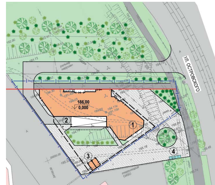
Схема генерального плана