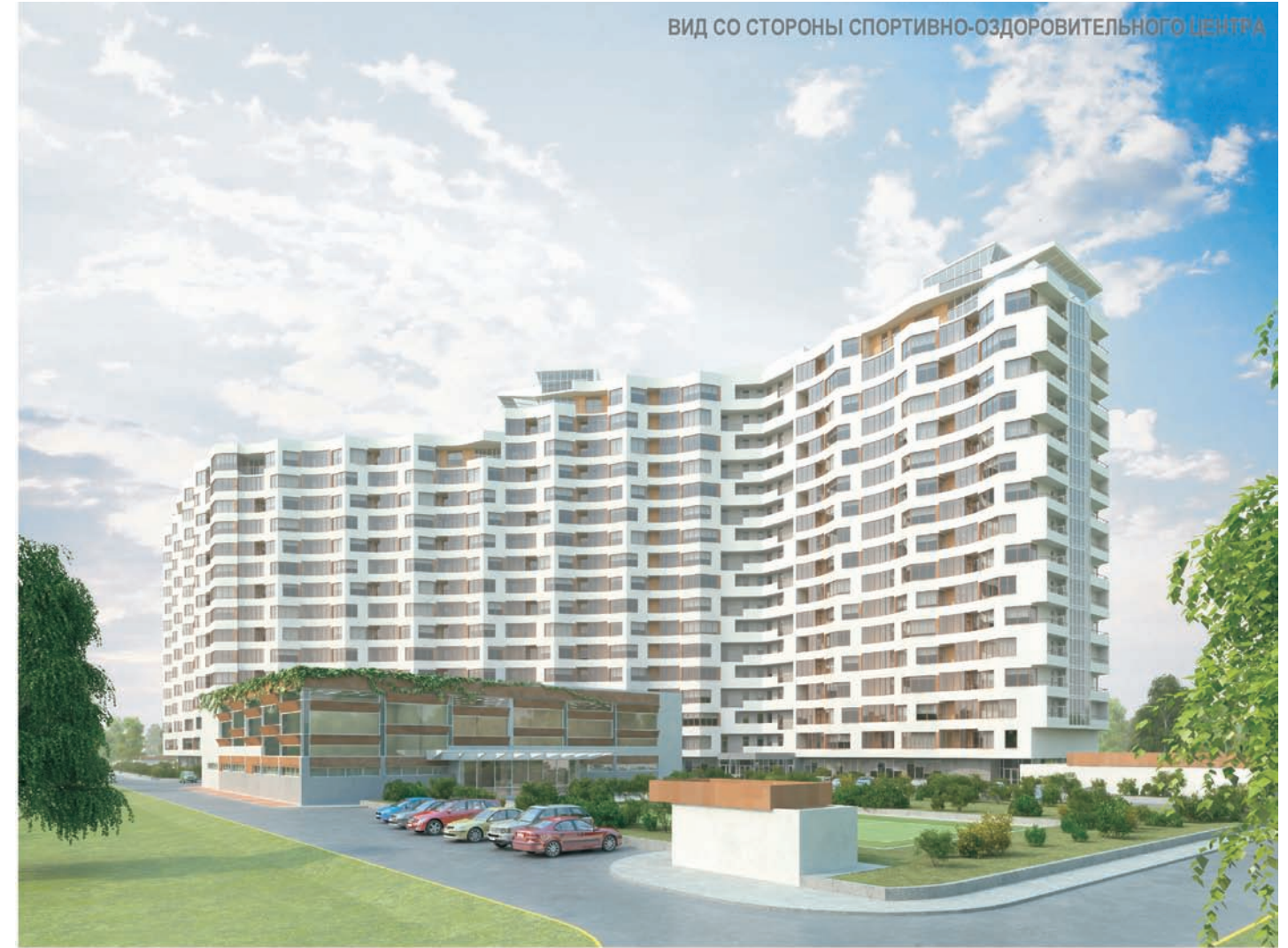
ВИД СО СТОРОНЫ СПОРТИВНО-ОЗДОРОВИТЕЛЬНОГО ЦЕНТРА