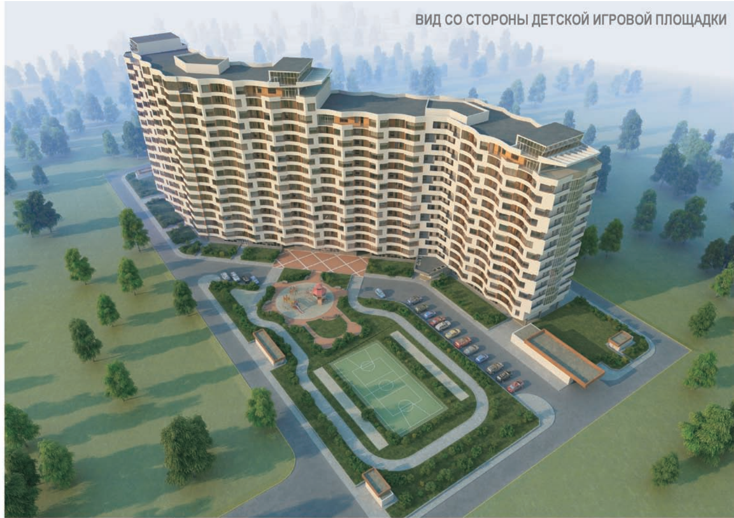
ВИД СО СТОРОНЫ ДЕТСКОЙ ИГРОВОЙ ПЛОЩАДКИ